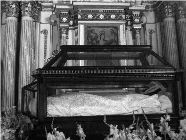
FIGURA 3. Imagen del Santo Entierro que se encuentra en la capilla de Nuestra Señora de la Soledad