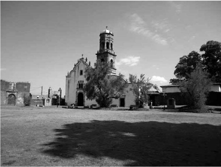
FIGURA 2. Vista de la capilla de Nuestra Señora de la Soledad

Fotografía tomada por el autor en diciembre de 2013.