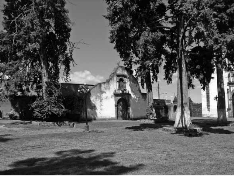
FIGURA 4. Vestigios de la capilla de la Tercera Orden