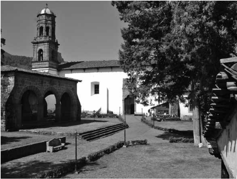
Fotografía del autor, julio de 2006.